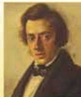
Fryderyk Chopin Notturmi, Polacche per Pianoforte

VIRTUOSISMO Brani di eccezionale difficoltà tecnica