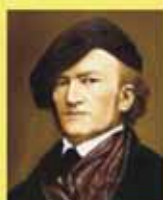
Richard Wagner La Valkiria Tannhäuser

MUSICA STRUMENTALE Sinfonie, Poemi sinfonici, Sonate, Concerti, ecc.