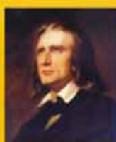
Franz Liszt 6 Studi trascendentali Rapsodie ungheresi