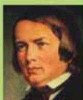
Robert Schumann Album per la gioventù Carnaval

VIRTUOSISMO Brani di eccezionale difficoltà tecnica