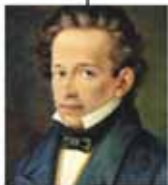
Giacomo Leopardi L'infinito