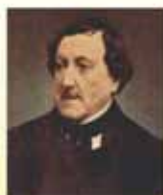
Gioacchino Rossini Il Barbiere di Siviglia Guglielmo Tell

MELODRAMMA che comunemente chiamiamo Opera