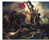
Eugène Delacroix La libertà che guida il popolo