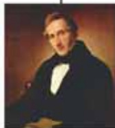
Alessandro Manzoni I Promessi Sposi