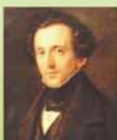
Felix Mendelssohn Sogno di una notte di mezza estate Romanze senza parole