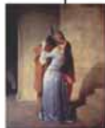
Francesco Hayez Il bacio