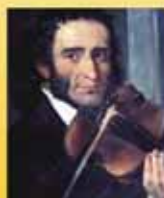
Niccolò Paganini 24 Capricci per violino solo Il carnevale di Venezia