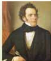
Franz Schubert Quintetto La Trata Sinfonia Incompiuta

MUSICA STRUMENTALE Sinfonie, Poemi sinfonici, Sonate, Concerti, ecc.