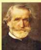
Giuseppe Verdi Il Nabucco Aida