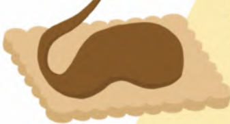
Glassa di cioccolato

Cospargi il biscotto con la glassa al cioccolato.